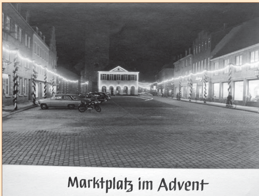
Marktplatz im Advent

An Kirmessen gab es in Dorsten mehrere. Patron der Stadt war bei dem kaufmännischen Charakter derselben der hl. Nikolaus. Die Kirmes an seinem Tage war ebenso sehr „unsere“ Kirmes 3) , als die um den 20. September 4) . Als dritte Kirmes findet sich die St. Johannis-Kirmes 5) und als vierte die St. Katharinen-Kirmes 6) . Ob auch mit der St. Agatha-Kirmes, die schon 1359 als Patronin der Pfarrkirche genannt wird, ein Markt verbunden war, weiß ich nicht. Als sechste Kirmes findet sich schon 1589 7) am 4. Mai die sogenannte „Neue Kirmes“, die auch in den folgenden Jahrhunderten stets „neue Kirmes“ genannt wird. Sie scheint erst 1658 mit einem Markt verbunden worden zu sein, da in den R. R. 1658 die merkwürdige Notiz steht, „als die neue Kirmes worde zugelassen,“ was ich auf